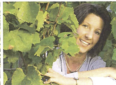
Oben: Schickes Ambiente und tolle Weine in der Weingalerie in Brixen.